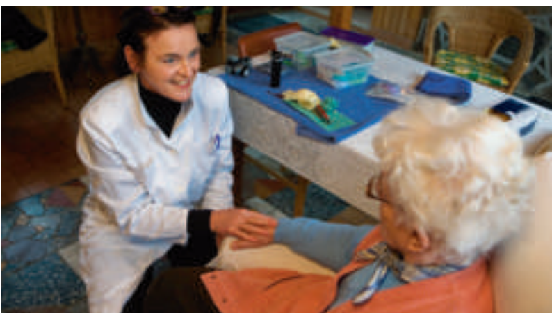
Mobile Praxen können ein Modell der Zukunft sein.

GRÜNE In der Pflicht sehe ich alle Akteure: Die Selbstverwaltung der Ärzteschaft und Krankenkassen, die Kommunen und natürlich auch das Land. Nur zusammen können wir erfolgreich den Herausforderungen des demographischen Wandels begegnen. Konkret halte ich Eigeneinrichtungen der Kommunen mit angestellten Zahnärzten für einen Weg. Mobile Zahnarztpraxen wie beispielsweise in Brandenburg sind sicherlich auch ein innovativer Ansatz. Grundsätzlich haben wir über das klassische Modell der Einzelarztpraxis in eigener Niederlassung hinaus zu denken, um die Versorgung in ländlichen Regionen zu sichern.