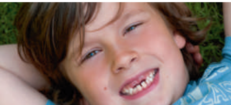
Zahnärztliche Prävention, insbesondere bei Kindern, ist ein Thema in der Landespolitik.

ÄRZTLICHE ZUSAMMENARBEIT MVZ's sind eine sinnvolle Ergänzung in der Versorgungslandschaft. Es ist gerade für junge Ärztinnen und Ärzte ein niedrigschwelliger Einstieg in die ambulante Versorgung, wenn die eigene Niederlassung noch abschreckt. Nicht jeder möchte sich gleich mit hohen Investitionen langfristig binden, da ist ein Angestelltenverhältnis eine gute Alternative. Die steigenden Zahlen der angestellten Ärztinnen und Ärzte weisen in diese Richtung. Eine zu starke Konzentration von Arztgruppen in Ballungszentren ist natürlich zu vermeiden. Auch Fachärzte sollten möglichst wohnortnah anzutreffen sein. Aber auch hier gilt: Kooperation vor Ort kann eine gute Versorgung sichern. Wenn etwa Rufbusse auf Praxiszeiten angepasst sind oder Rotationsprechstunden von Kommunen mit einem MVZ vereinbart werden.