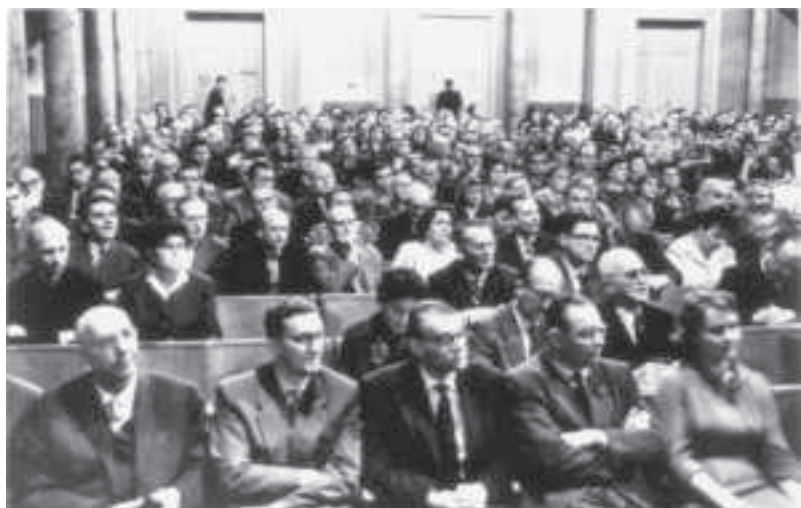
Tagungsteilnehmer im Jahre 1959 in den Räumen der heutigen Leopoldina in Halle.

Auf diese Weise erhalten angehende Kolleginnen und Kollegen die Möglichkeit, zusätzlich zum wissenschaftlichen Programm, bei einer gesonderten Rahmenveranstaltung in ungezwungener Runde erste Kontakte zur Zahnärzteschaft zu knüpfen. Ihnen wird die Notwendigkeit des kontinuierlichen kollegialen Austausches mit erfahrenen Kollegen, Referenten und natürlich den Kommilitonen in angenehmer Atmosphäre nahegebracht. Durch dieses bewusste Heranführen junger Zahnärzte an die Ziele und Aufgaben einer wissenschaftlichen Gesellschaft soll der in der Vergangenheit funktionierende und zwischenzeitlich aus der Mode gekommene Alumni-Charakter der Absolventinnen und Absolventen der Martin-Luther-Universität Halle-Wittenberg wieder gestärkt werden. Neben den immer aktuellen und sehr praxisrelevanten Fortbildungsvorträgen mit hochkarä-