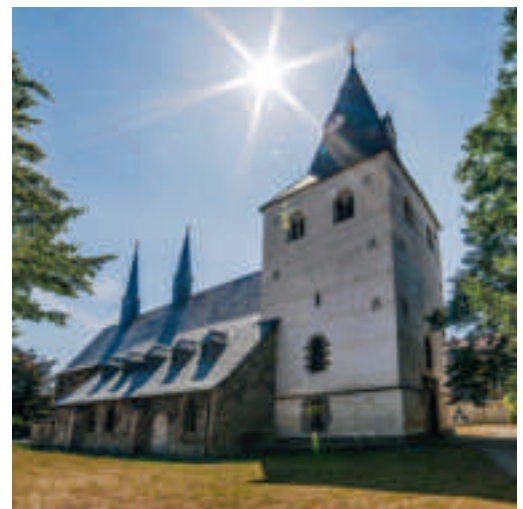
Kirche St. Johannis in Wernigerode