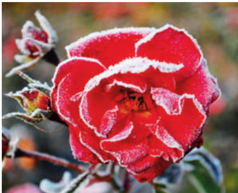
Wittstock hat seit Jahren den Ruf als „Stadt der Rosen“.