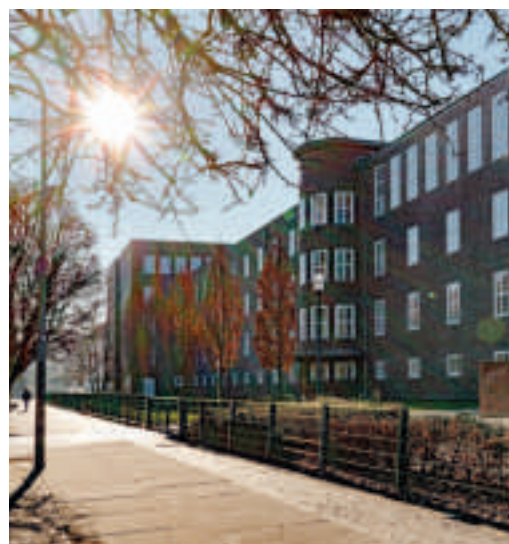
Comenius Sekundarschule in Stendal Titelbild: Fredi Fröschki