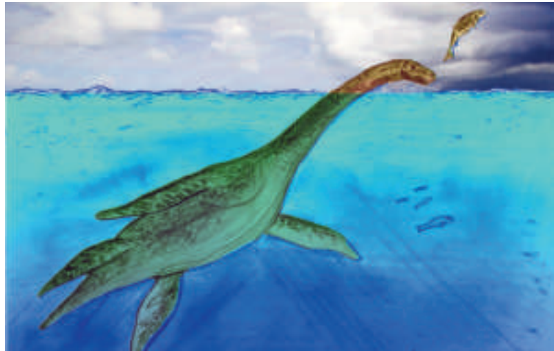
Illustration eines Schlangenhalsosauriers auf Fischfang. Mit ihrem mehrere Meter langen Hals waren die Tiere die „Giraffen“ der Jura-Meere. Zeichnung: Uwe Seidenfaden

Zu den größeren Raubtieren im „Jurassic Sub-Boreal Seaway“ zählten vor etwa 190 Millionen Jahren die sogenannten Schlangenhalsosaurier (Plesiosaurus). In ihrer Körperform und den vier zu Paddeln umgestalteten Extremitäten ähnelten sie Meeresschildkröten. Charakteristisch für die Plesiosaurier war ihr schlanker, mehrere Meter langer Hals, der ihnen vermutlich bei der Jagd nach Fischen half. Ihre Zähne und ihr Mageninhalt weisen darauf hin, dass sie auch kleine, am Meeresgrund lebende Schalentiere fraßen. Zum Ende der Jura-Periode vor rund 150 Millionen Jahren stieg der Meeresspiegel im „Jurassic Sub-Boreal Seaway“ innerhalb von etwa 18 Millionen Jahren auf über 200 Meter an, wie Veränderungen der Meeresablagerungen zeigen. Damit verbunden war ein Rückgang von Schlangenhalsosauriern. An ihre Stelle traten zunehmend die sogenannten Ichthyosaurier. Im Körperbau ähnelten sie heutigen Delphinen. Sie waren ausschließlich an das Leben im Wasser angepasst. Ausgestattet mit einem kräftigen Kiefer, rund 200 kegelförmigen Zähnen und Augen von der Größe eines Suppentellers, konnten sie vermutlich auch in dunklen Tiefen jagen. Parallel dazu entwickelten sich neue Arten wie die Pliosaurier. Sie besaßen einen kürzeren Hals als die Schlangenhalsosaurier, einen größeren Schädel und einen starken Kiefer mit kräftigen, abgestumpften Zähnen. Damit waren sie für die Jagd nach größeren Fischen in größeren Tiefen optimal ausgerüstet.