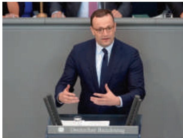
Bundesgesundheitsminister Jens Spahn.

Die abschließende 2. und 3. Lesung des Gesetzes im Plenum des Deutschen Bundestages wird voraussichtlich im Frühjahr 2019 stattfinden. Sie können sicher sein, dass die von Ihnen vorgebrachten Kritikpunkte im Gesetzgebungsverfahren angesprochen werden.