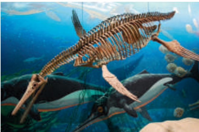
Meeressaurier: Skelett eines Schlangenhalsosauriers, darunter Zeichnung eines Fischesauriers (Ichthyosaurier) im Naturkundemuseum Washington D.C.